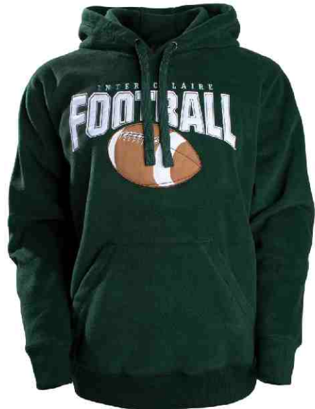
#529 13 onces Laine Polaire