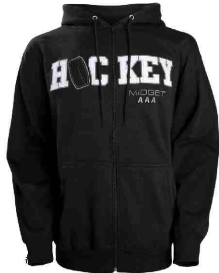
#369 12 onces 65% coton / 35% polyester Molleton