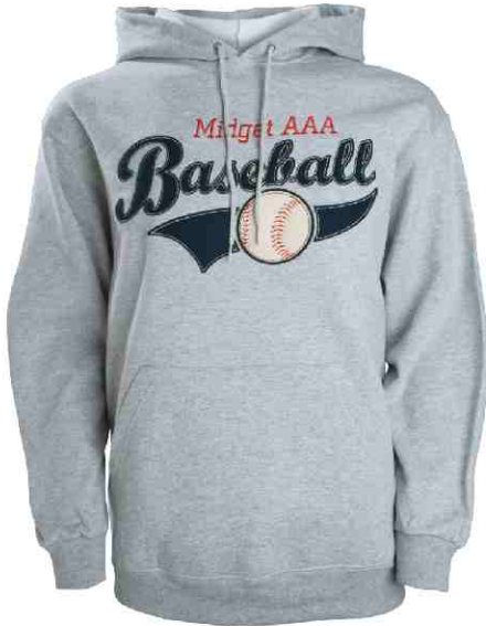
#368 ou Fruit of the Loom 65% coton / 35% polyester Molleton